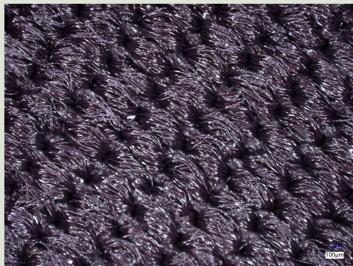
图1 跑步运动服表面结构